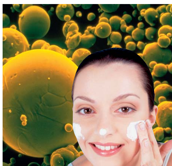
Hautcreme: Natürlich abbaubare Nano-Trägerstoffe bringen Vitamine ans Ziel.